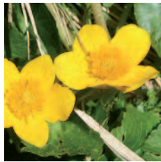
Populage des marais