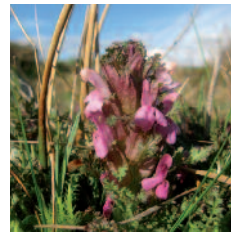
Pédiculaire des bois